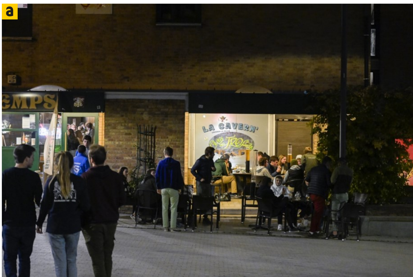
Heure de fermeture, nombre de personnes par table, port du masque, le Codeco a défini les conditions de réouverture des terrasses.

Le protocole pour la réouverture des terrasses le 8 mai a été précisé ce vendredi lors du Codeco. Les terrasses devront fermer à 22 h.